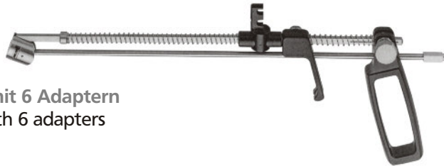
Uterus-Manipulator, komplett mit 6 Adaptern Uterus-Manipulator, complete with 6 adapters