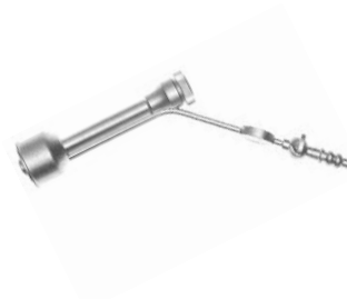
Portio-Hysteroskopie-Adapter klein small Portio-Hysteroscopy-Adapter gross large