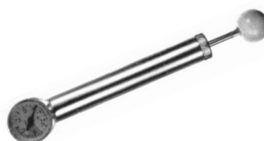
Vakuum-Handpumpe mit Manometer Manual vacuum pump with manometer